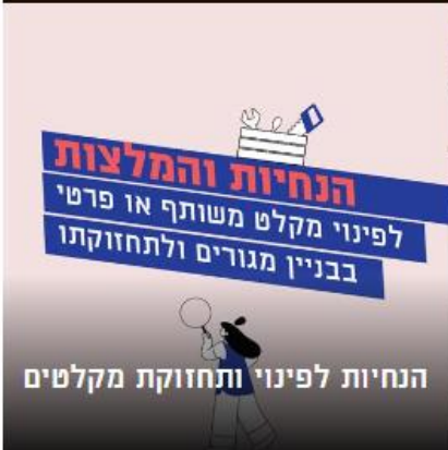
הנחיות לפינוי ותחזוקת מקלטים