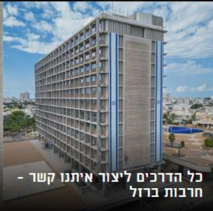
כל הדרכים ליצור איתנו קשר - חרבות ברזל