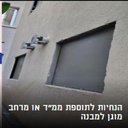
הנחיות לתוספת ממ"ד או מרחב מוגן למבנה