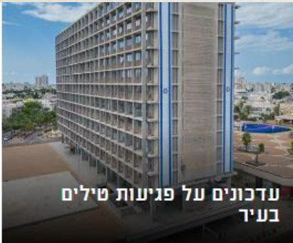
עדכונים על פגיעות טילים בע"ד