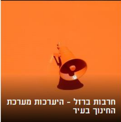
חרבות ברזל - היערכות מערכת החינוך בע"ד