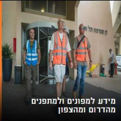
מידע למפונים ולמתפנים מהדרום ומהצפון