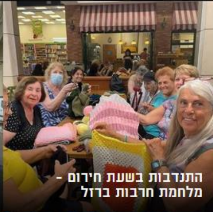
התנדבות בשעת חירום - מלחמת חרבות ברזל