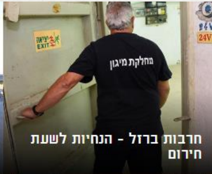
חרבות ברזל - הנחיות לשעת חירום