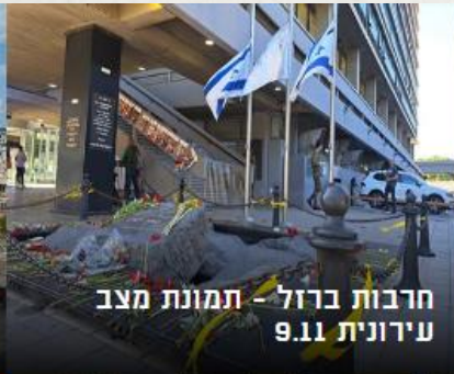
חרבות ברזל - תמונת מצב עירונית 9.11