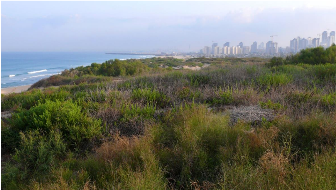
הדיונה באשדוד